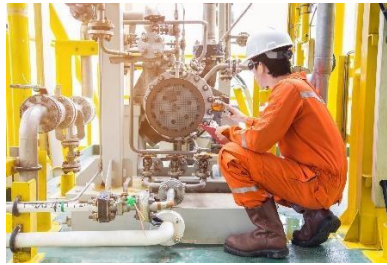
Figura 1. Mantenimiento Industrial

En el futuro, se prevé que el mantenimiento evolucione hacia el uso de sistemas expertos e inteligencia artificial, lo que permitirá realizar diagnósticos más precisos y ejecutar tareas de mantenimiento incluso en condiciones complejas.(Muñoz María, 2016)