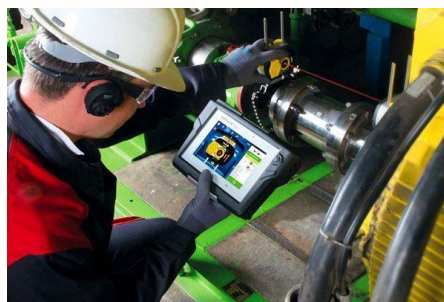
Figura 2. Mantenimiento Predictivo

Entre sus principales ventajas destaca la capacidad de registrar el historial de los parámetros monitoreados, lo cual resulta invaluable frente a fallos recurrentes. Además, permite programar reparaciones con anticipación, coincidiendo con paradas planificadas del equipo, y reduce la necesidad de intervenciones frecuentes por parte del personal de mantenimiento. (Muñoz María, 2016)