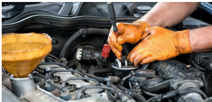
Figura 4. Mantenimiento Correctivo