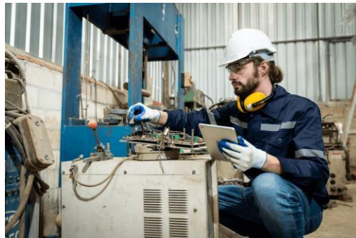
Figura 6. Mantenimiento preventivo de una máquina

Es el tipo de mantenimiento cuyo objetivo es garantizar un nivel específico de funcionamiento en los equipos, planificando intervenciones en sus puntos críticos en el momento más adecuado. Generalmente, tiene un enfoque sistemático, lo que implica realizar acciones preventivas incluso si el equipo no muestra signos de fallo. (Fernández Álvarez & González Rodríguez, 2018)