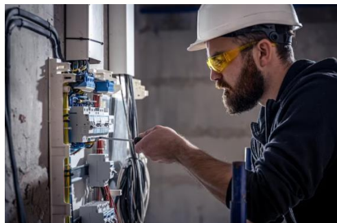
Figura 8. Mantenimiento Correctivo de un tablero de control eléctrico industrial

Otra desventaja es la necesidad de mantener una inversión considerable en el almacenamiento de repuestos. (Muñoz María, 2016)