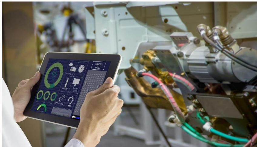
Figura 5. Mantenimiento predictivo de una máquina

Entre los parámetros que pueden analizarse se encuentran: temperatura, presión, velocidad lineal y angular, resistencia eléctrica, ruidos y vibraciones, rigidez dieléctrica, viscosidad, niveles de humedad, impurezas y cenizas en aceites aislantes, espesor de materiales, niveles de fluidos, entre otros. (Muñoz María, 2016)