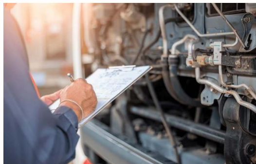
Figura 3. Mantenimiento Preventivo